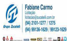
image001.jpg 9 KB