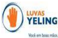
image010.jpg 2 KB