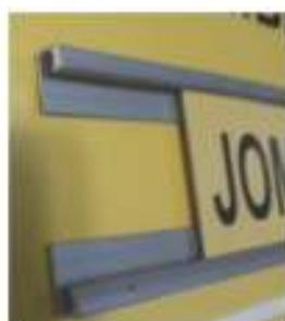
Detalhe do perfil de alumínio