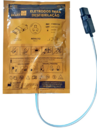
Imagem meramente ilustrativa Eletrodo para desfibrilador LIFE 400 CMOS DRAKE F7988W/CM