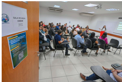
Sala de aula da Escola Superior de Magistratura do TJAM

2.2 E para tanto, necessitam de equipamentos para suporte à realização das missões institucionais daquelas Escolas.