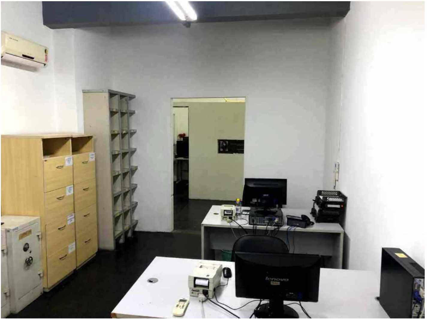
Depósitos e Salas de Bens: