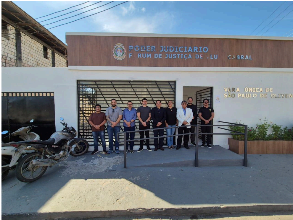
Correição realizada na Vara Única de São Paulo de Olivença