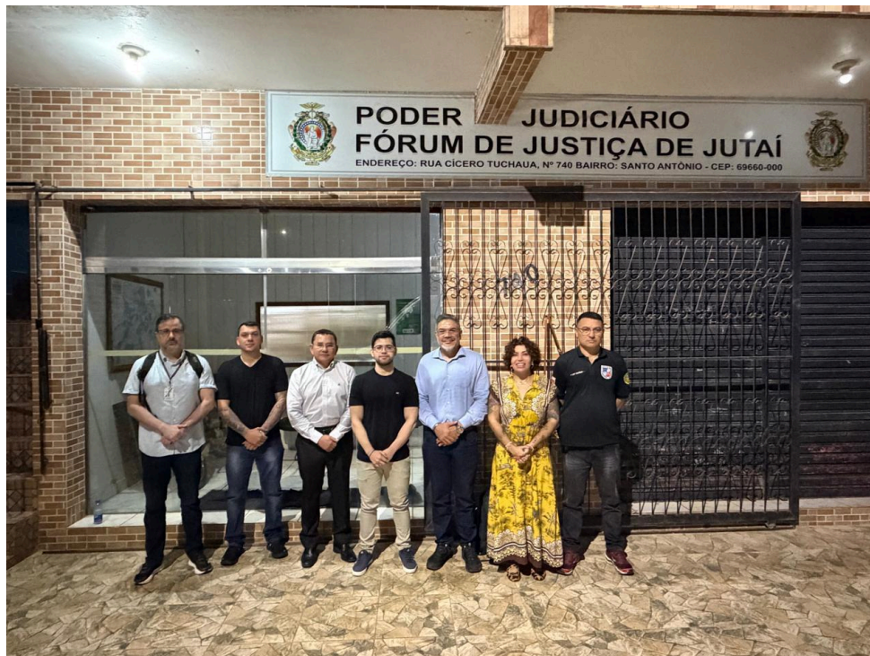
Correição realizada na Vara Única da Comarca de Jutai