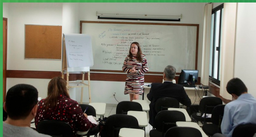
SALA DE AULA DA ESMAM