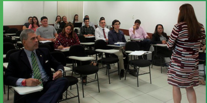
SALA DE AULA DA ESMAM