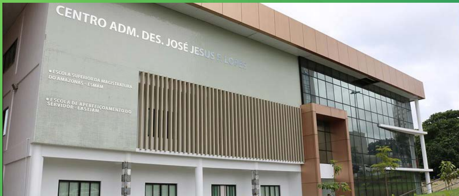
CENTRO ADM. DES. JOSÉ JESUS F. LOPES

A Escola Superior da Magistratura do Amazonas (ESMAM) foi criada pela Lei Complementar nº 17, de 23 de janeiro de 1997. Iniciou as atividades em 1999, com turmas do curso Preparatório à Carreira da Magistratura, em um prédio histórico localizado no centro da cidade.