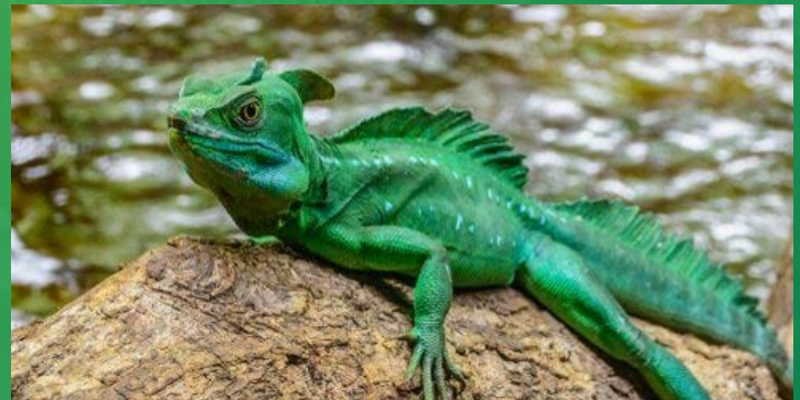
IGUANA VERDE