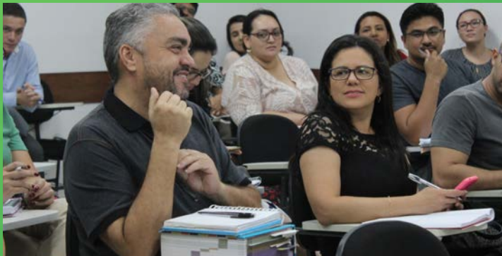
SALA DE AULA DA ESMAM

Assim, vem buscando, através de parcerias, oferecer cursos de pós-graduação como especialização, mestrado e doutorado.