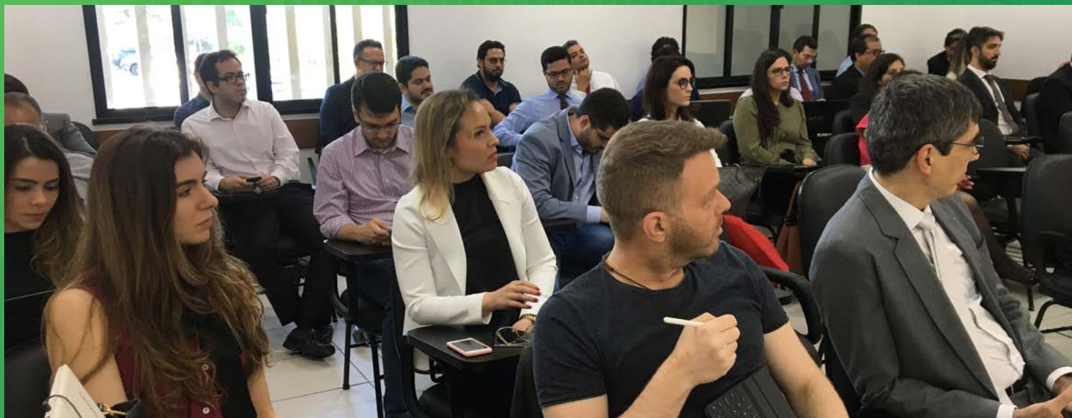
SALA DE AULA DA ESMAM

O formato dos cursos pode ser presencial, a distância ou semipresencial, com enfoque prático e utilização de estudos de caso.