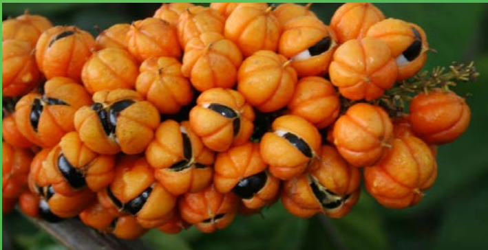
GUARANÁ DA AMAZÔNIA CRÉDITO: REDAÇÃO INFORME MANAUS.

Segundo a World Wide Fund for Nature Brasil (WWF Brasil), foram classificados cientificamente no bioma cerca de 40 mil espécies de vegetais; 427, de mamíferos; 1294, de aves; 378, de répteis; 427, de anfíbios; aproximadamente 3 mil espécies de peixes; e cerca de 128.840 espécies de invertebrados.