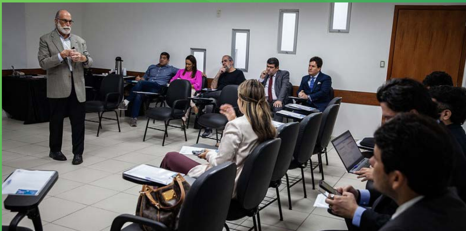
SALA DE AULA DA ESMAM

O curso de Formação de Formadores (FOFO), é voltado para magistrados do Tribunal de Justiça do Amazonas (TJAM) e membros de outras instituições do Sistema de Justiça, o curso busca a qualificação pedagógica dos docentes que atuam nas Escolas Judiciais e da Magistratura. É realizado em parceria com a Escola Nacional de Formação e Aperfeiçoamento de Magistrados (Enfam), oferecendo subsídios para a atuação docente, considerando as particularidades do público alvo e o impacto prático das atividades de aprendizagem no cotidiano da profissão de magistrados.