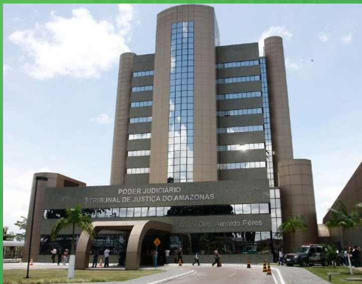
TRIBUNAL DE JUSTIÇA DO AMAZONAS ED. DES. ARNALDO PÉRES

A sede fica em Manaus, onde atua o segundo grau da corte de justiça, além de unidades administrativas.