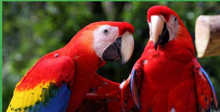
ARARA DA AMAZÔNIA