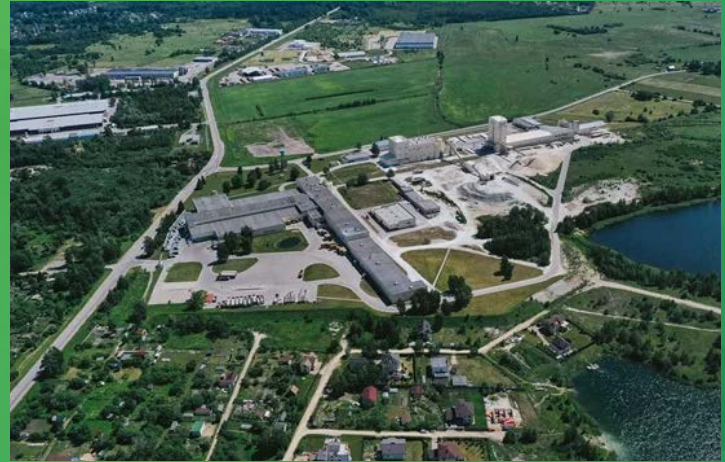
ZONA FRANCA DE MANAUS

A cidade de Manaus é o principal centro econômico, político e demográfico do Norte do Brasil. Está localizada em plena Floresta Amazônica, bioma de grande biodiversidade. É a capital mais importante do estado e o principal polo de oferta de comércio e serviços do norte brasileiro.