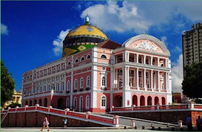
TEATRO AMAZONAS