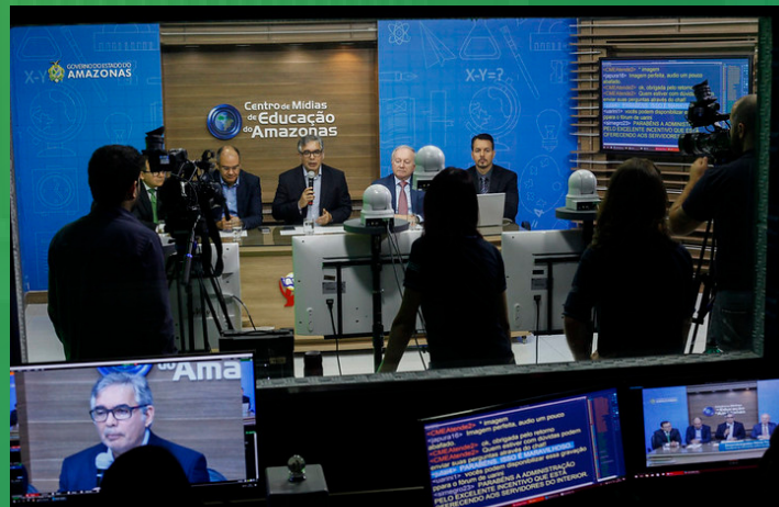
CENTRO DE MÍDIAS DA SEDUC CRÉDITO: CHICO BATATA

Tal medida, além de gerar a racionalidade de recursos, possibilitou o acesso a conhecimentos fundamentais ao magistrados e servidores, com benefício social incalculável. Porém, os maiores beneficiados com a formação continuada de magistrados são os próprios jurisdicionados, sendo esta uma medida de acesso à justiça no seu aspecto material. Ainda assim, encontrar soluções para as dificuldades apresentadas é um desafio contínuo, sendo superado com criatividade, pesquisa e parcerias.