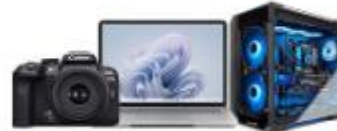
For Camera / Laptop / PC