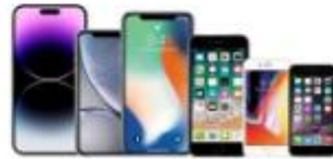
For iPhone 14 / 13 / 12 / 11 / XR / X / 8 / 6