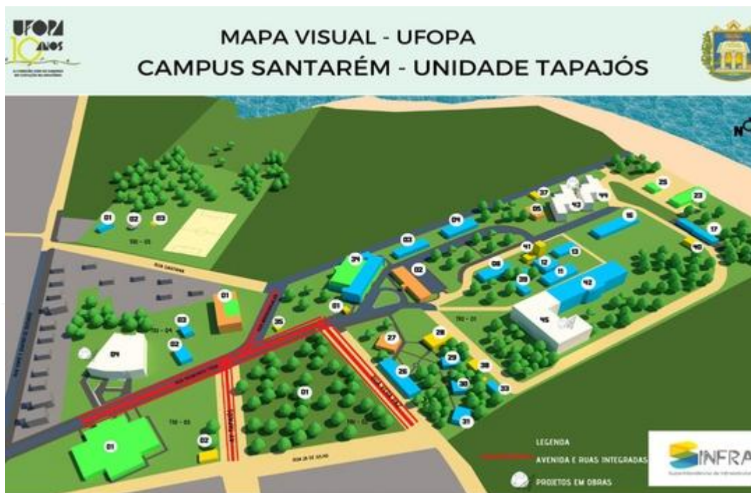
Figura 01: Visão superior da UFOPA e suas principais infraestruturas refrigeradas.