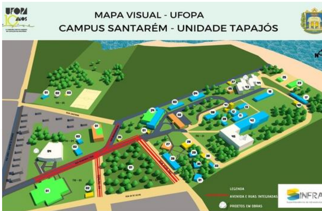
Figura 01: Visão superior da UFOPA e suas principais infraestruturas refrigeradas.