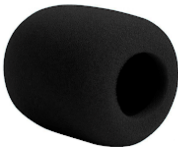
ITEM 06 - CATÁLOGO - ESPUMA MICROFONE.png 591K