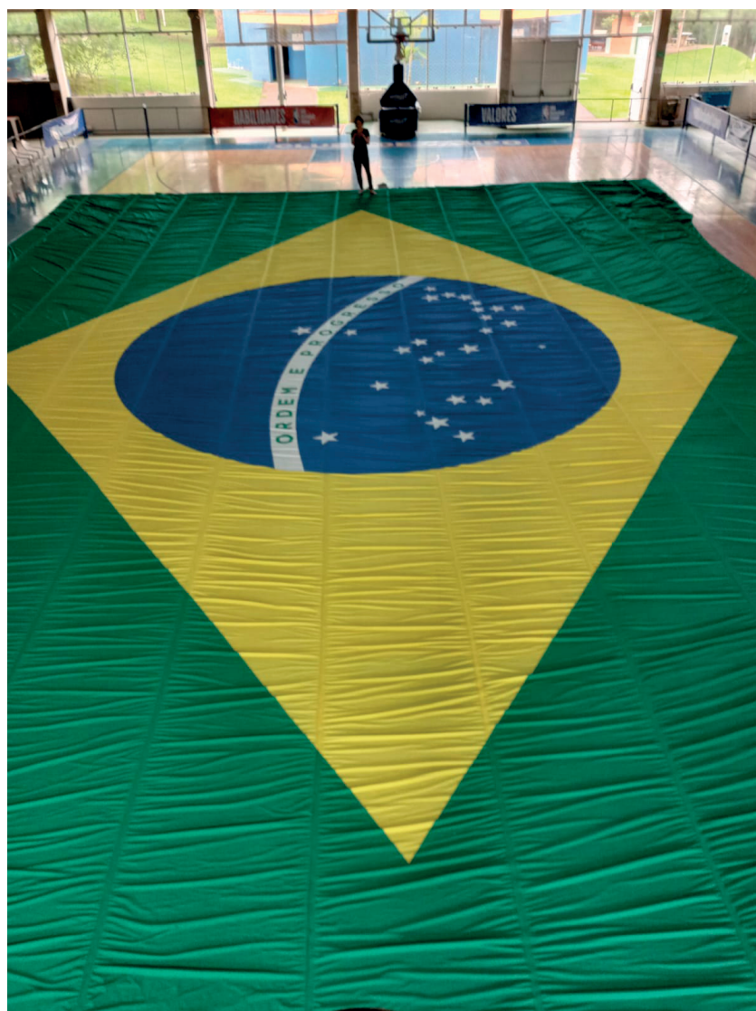
Bandeirão de Brasília 14x20m

Bandeiras com tamanho inferior duram até um ano.