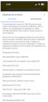
WhatsApp Image 2026-01-27 at 11.17.58.jpeg 129K