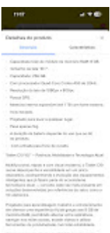
WhatsApp Image 2026-01-27 at 11.17.57 (2).jpeg 146K