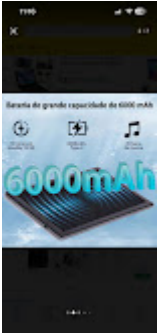
WhatsApp Image 2026-01-27 at 11.17.56 (1).jpeg 100K