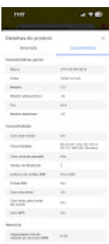
WhatsApp Image 2026-01-27 at 11.17.59.jpeg 75K