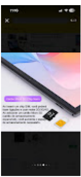
WhatsApp Image 2026-01-27 at 11.17.57 (1).jpeg 84K