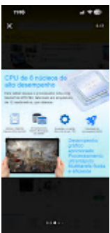
WhatsApp Image 2026-01-27 at 11.17.57.jpeg 118K