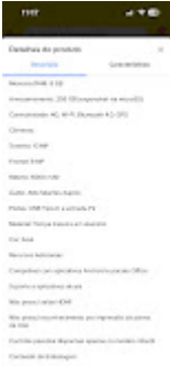
WhatsApp Image 2026-01-27 at 11.17.58 (1).jpeg 82K