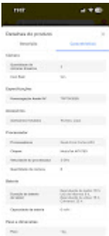
WhatsApp Image 2026-01-27 at 11.17.59 (2).jpeg 78K