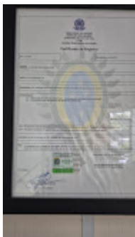
WhatsApp Image 2026-01-21 at 12.48.09 (1).jpeg 99K