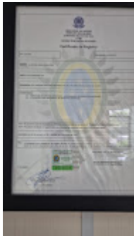
WhatsApp Image 2026-01-21 at 12.48.09.jpeg 99K