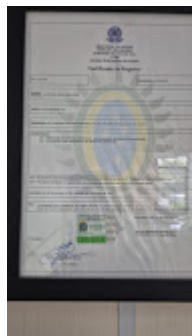
WhatsApp Image 2026-01-21 at 12.48.09.jpeg 99K