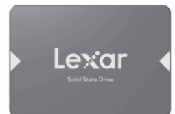
SSD Lexar® NS100 2,5" SATA III (6 Gb/s)