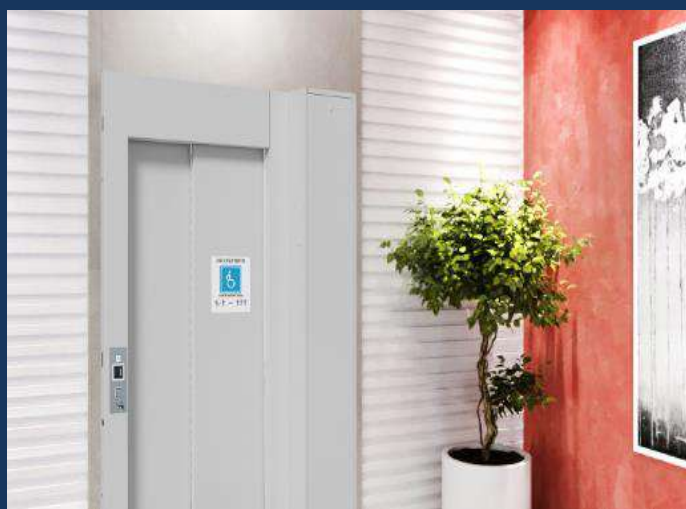
Quadro de comando VVF, localizado junto a porta de pavimento superior ou inferior.