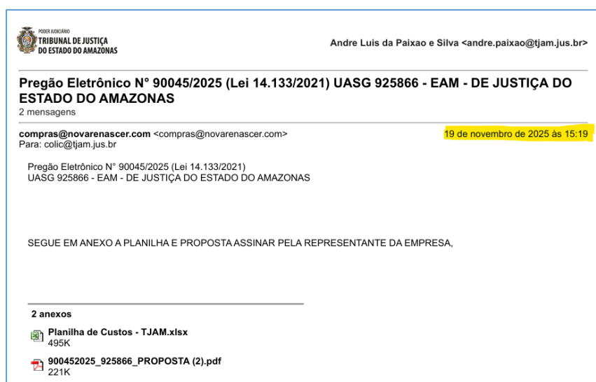
Figura 3. Registro do envio dos documentos da RECORRENTE as 15h19min (Manaus) ou seja 16h 19min (Brasília).

Para não restar dúvidas, vejamos agora o horário que a RECORRENTE enviou os documentos, e, diga-se de passagem, por meio diferente do exigido pelo Sr. Pregoeiro, ou seja, por e-mail: