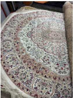
Persa Classico Oriental 6.jpeg 596K