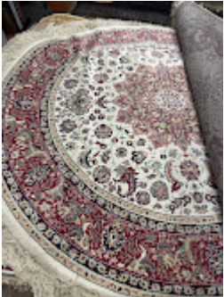
Persa Classico Oriental 5.jpeg 594K