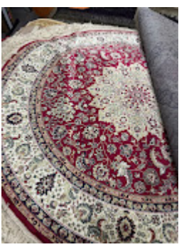
Persa Classico Oriental 1.jpeg 589K