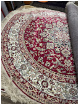
Persa Classico Oriental 2.jpeg 603K