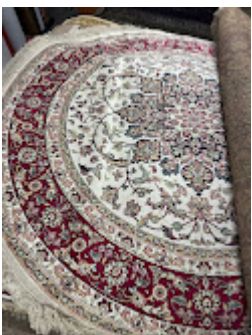
Persa Classico Oriental 7.jpeg 587K