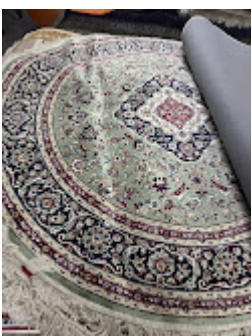
Persa Classico Oriental 4.jpeg 569K