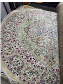
Persa Classico Oriental 3.jpeg 613K