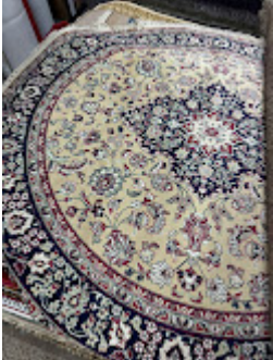
Persa Classico Oriental 8.jpeg 610K