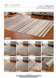
NIAZITEX - MEMARI - Podendo ser retangular ou redondo.jpeg 191K