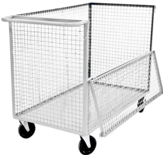
Carro caixa fechado em tela - Grupo 11