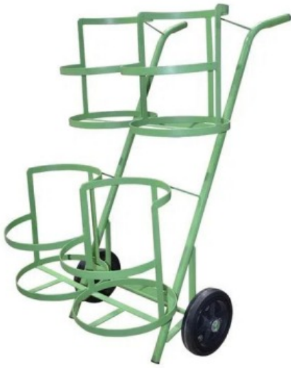
Carro de Transporte de água - Grupo 7