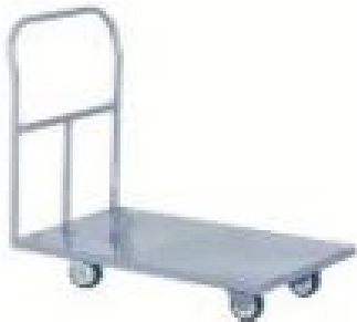
Carro plataforma - Grupo 9