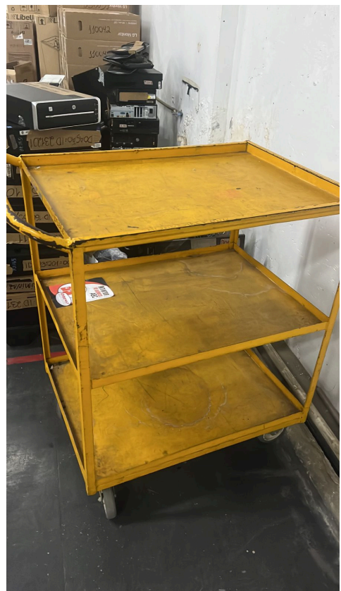
Carro de bandeja - Grupo 10