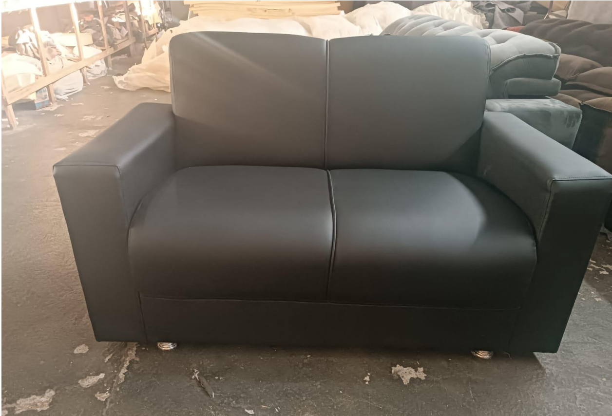
Reforma e higienização do estufamento

CNPJ: 48.619.375/0001-60 – Insc. Est.: 05.451.003-1 Rua Professor Sebastião Mestrinho, 68, Loja A, Cidade Nova – CEP: 69.094-130 Fone/WhatsApp: (92) 98273-2797 / 99164-4525 E-mail: officenobrecs@gmail.com Banco: Bradesco Agência: 5422 C/C: 97071-9