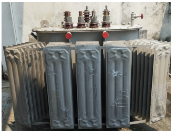
Figura 5 - Transformador 500kVA ITAM, ano 1987