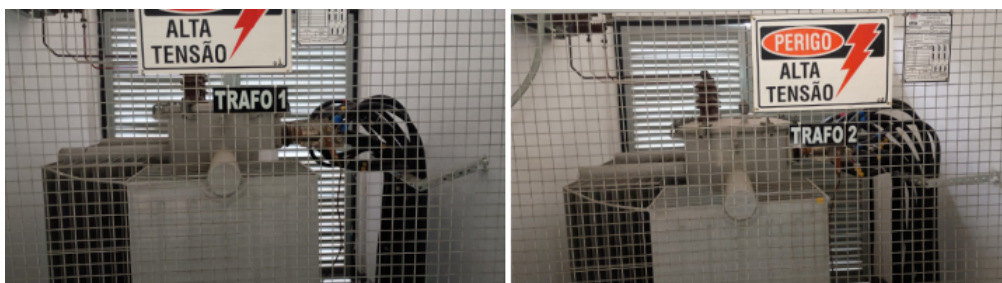
Figura 3 - Transformadores 1000kVA ITAM, ano 2000