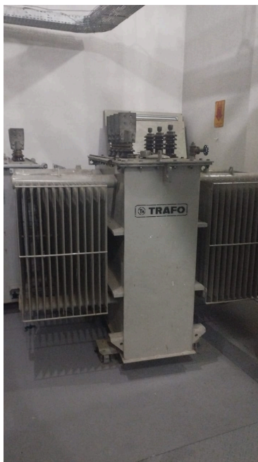
Figura 2 - Trafo 1000kVA ano 2000