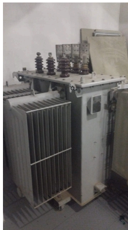
Figura 1 - Trafo 1000kVA ano 1998