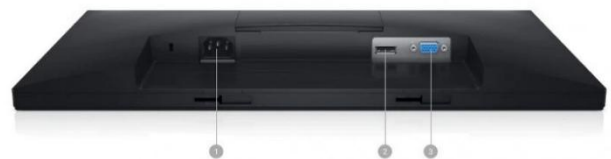
OPÇÕES DE CONECTIVIDADE PORTAS E SLOTS: 1. PORTA DE ENERGIA | 2. PORTA HDMI | 3. PORTA VGA