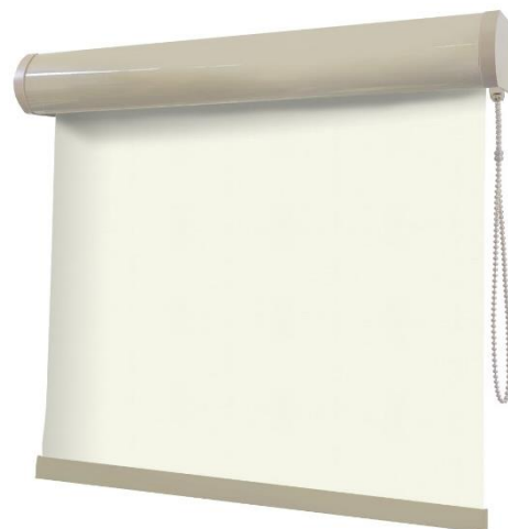
Imagem meramente ilustrativa (Tela Solar 5%)