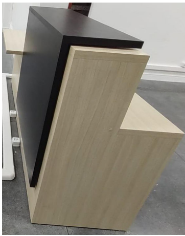
Vista lateral Imagem Ilustrativa