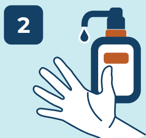
2 APLICAR SABÃO