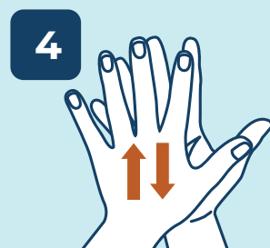
4 ESPUMAR AS COSTAS