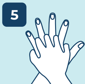
5 ESFREGAR ENTRE OS DEDOS