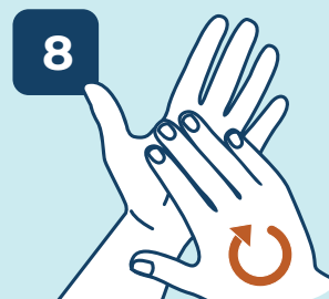
8 LAVAR AS UNHAS E AS PONTAS DOS DEDOS