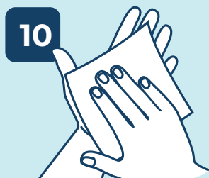
10 SECAR COM PAPEL TOALHA