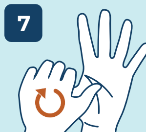
7 LIMPAR OS POLEGARES