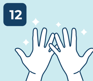
12 SUAS MÃOS ESTÃO LIMPAS