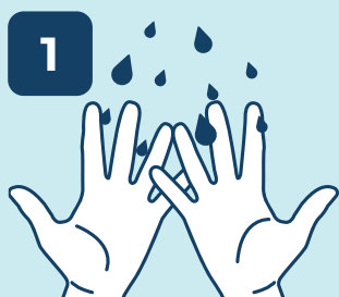
1 MOLHAR AS MÃOS

LAVE AS MÃOS CORRETAMENTE COM ÁGUA E SABÃO. SIGA AS DICAS ABAIXO